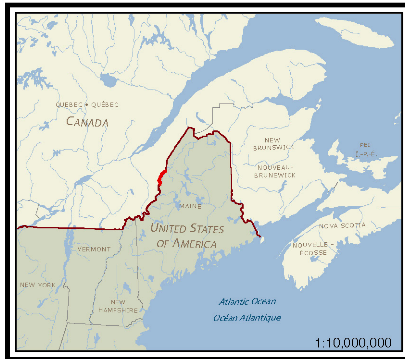
Figure 1 – Localisation de la section du Bras sud-ouest de la rivière Saint-Jean

La frontière devient une ligne intangible alors qu'elle sillonne le bras sud-ouest de la rivière Saint-Jean à partir de son intersection avec la ligne Sud jusqu'à sa source au Petit Lac Saint-Jean. Cette section de la frontière, longue de 61 kilomètres (38 miles), remonte cet étroit ruisseau peu profond à travers une dense forêt isolée. La frontière est définie par 1,045 points tournants référencés à des bornes situées sur la rive. Elle constitue une partie de la frontière entre la province de Québec (Canada) et l'état du Maine (États-Unis). La description originale de cette section se trouve aux pages 172 à 190 du « Report of the Reestablishment of the Boundary between the United States and Canada – Source of the St. Croix River to the St. Lawrence River » publié en 1924 par la Commission de la frontière internationale.